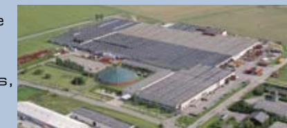
Nørre Alslev, Denemarken