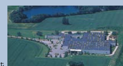
Hoje Taastrup, Denemarken