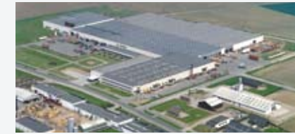
Denemarken, Nørre Alslev